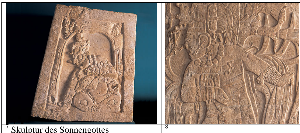
7 Skulptur des Sonnengottes