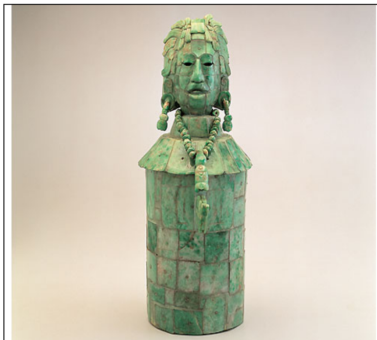
15 Gefäß mit Mosaik - König Yik'in Chan Ka'wiil ?