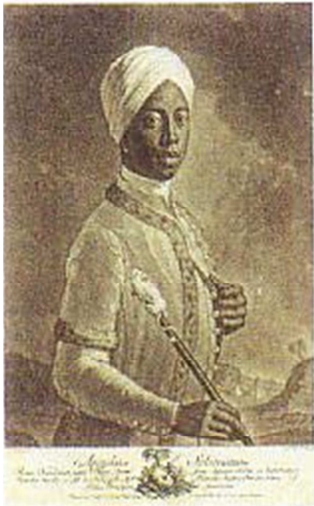
Pressefoto 1 (Plakatsujet) Johann Gottfried Haid (nach Johann Nepomuk Steiner) Angelo Soliman, um 1750