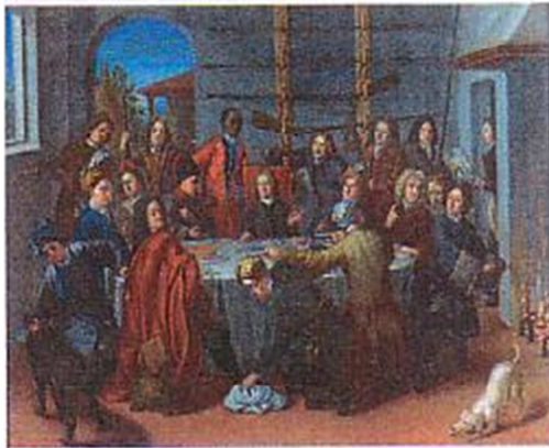
Pressefoto 2 Peter Jakob Horemans Umkreis Ein Jagdbankett des Fürsten Gian Gastone de' Medici mit Angelo Soliman (?), 1730–1750