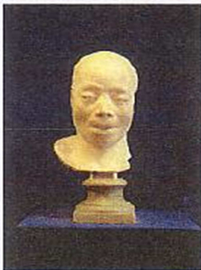
Pressefoto 8 Franz Thaller (?) Kopfabguss Angelo Soliman, 1796