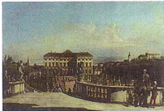
Pressefoto 3 Bernardo Bellotto (genannt Canaletto) Das Gartenpalais Liechtenstein in Wien, rechts der Fürst mit seinem „Hofmohren“, 1759/60