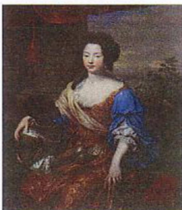
Pressefoto 9 Pierre Mignard Louise de Kérouaille, Duchess of Portsmouth (mit Diener), 1682