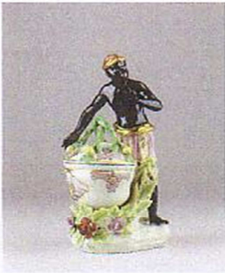
Pressefoto 5 Mohrenfigur, um 1747–1749 Galerie Bednarczyk, Wien