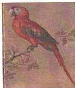
Hellroter Ara Daniel Fröschel (1563–1613) Bestiaire/Museum Rudolfs II., Bd. II Prag, ca. 1580–1612