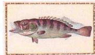
Barsch Giorgio Liberale (1527–vor 1580) Meeresfauna des adriatischen Meeres Görz/Innsbruck, 1562–1579