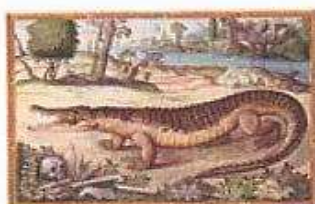
Nilkrokodil Giorgio Liberale (1527–vor 1580) Meeresfauna des adriatischen Meeres Görs/Innsbruck, 1562–1579 nilkrokodil.jpg