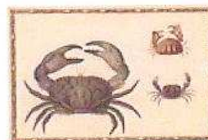
Taschenkrebs, gelbe Krabbe und Schamkrabbe Versoseite Giorgio Liberale (1527–vor 1580) Meeresfauna des adriatischen Meeres Görz/Innsbruck, 1562–1579