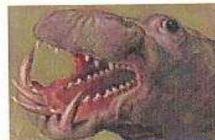
Flusspferd Unbekannt Bestiaire/Museum Rudolfs II., Bd. I Prag, ca. 1580–1612