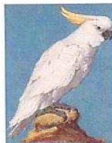
Gelbhaubenkakadu Unbekannt Skizzenbuch Prag, 2. Hälfte 16. Jh. kakadu.jpg