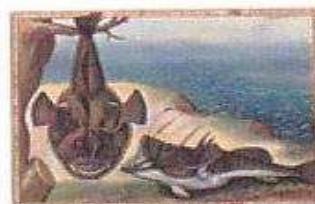
Seeteufel Giorgio Liberale (1527–vor 1580) Meeresfauna des adriatischen Meeres Görs/Innsbruck, 1562–1579 seeteufel.jpg