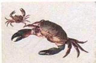
Strandkrabbe und Taschenkrebs Jacopo Ligozzi (um 1547–1626) zugeschrieben Fischalbum Prag, 2. Hälfte 16. Jh. taschenkrebs.jpg

Die Ausstellung zeigt auf beeindruckende Weise die Verbindung der naturwissenschaftlichen Funktion und der künstlerischen Ästhetik dieser Tierbilder zu herausragenden Werken. Einige der schönsten Ergebnisse sind in dieser Sonderschau zu sehen.