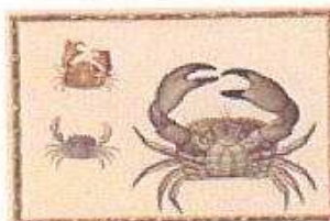
Taschenkrebs, gelbe Krabbe und Schamkrabbe Rectoseite Giorgio Liberale (1527–vor 1580) Meeresfauna des adriatischen Meeres Görz/Innsbruck, 1562–1579