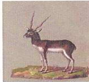
Hirschziegenantilope Kopie nach Giuseppe Arcimboldo (1526–1593) Bestiaire/Museum Rudolfs II., Bd. I Prag, ca. 1580–1612