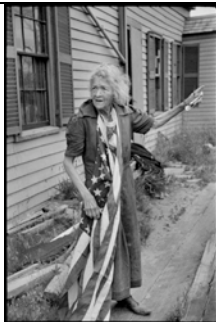
USA. Massachusetts. Cape Cod. 4. Juli 1947. Unabhängigkeitstag.