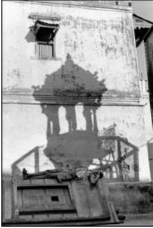
INDIEN. Gujarat. Ahmedabad. 1966. In der Altstadt.