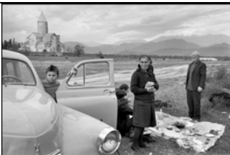
GEORGIEN. Kakheti. Telavi. 1972. Kloster Alavardi (11. Jahrhundert). Besucher aus den Kolchosen feiern den hl. Georg.