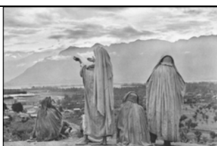
INDIEN. Kaschmir. Srinagar. 1948. Muslimische Frauen auf den Hängen des Hari Parbal-Hügels beim Beten zur hinter dem Himalaya aufgehenden Sonne.