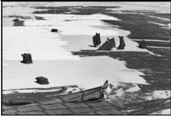
INDIEN. Gujarat. Ahmedabad. 1966. Frauen beim Ausbreiten ihrer Saris in der Sonne.