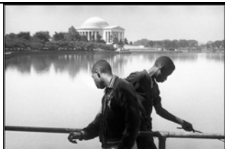
USA. Washington DC. 1957.