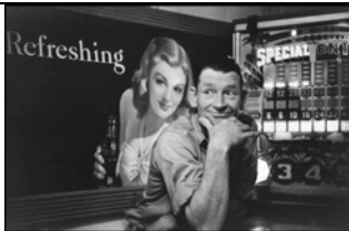
USA. Texas. Uvalde. 1947. Speisewagen.

Die Fotonachweise unter den jeweiligen Fotos müssen zumindest bis inklusive der Jahreszahl und mit dem ©-Vermerk veröffentlicht werden.