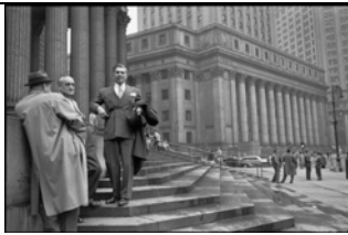
USA. New York City. Manhattan. 1947. Nahe der Hall of Records.