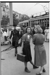
SOWJETUNION. Moskau. 1954.