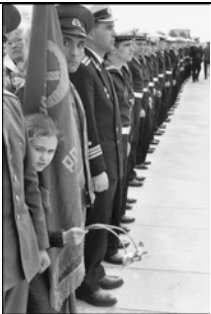
SOWJETUNION. Leningrad. 9. Mai 1973. Gedenken an den Sieg über die Nazis.