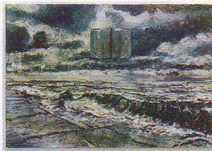
AK_Nur mit Wind.jpg