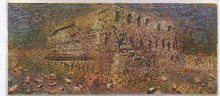
AK_The Fertile Crescent.jpg