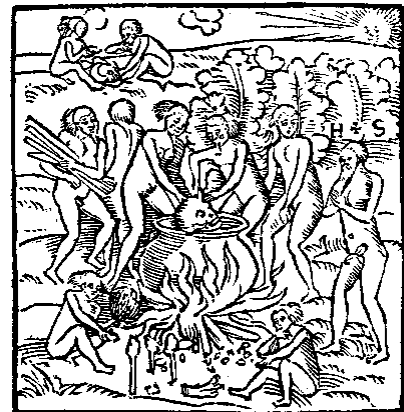
Abbildung: Ein Holzschnitt aus Stadens „Wahrhaftige Historia“

Zitat: Sie leben nackt, ohne Religion, ohne Gesetz, sie sind dumm etc. {stimmt so nicht ganz, aber ich find's nicht...}